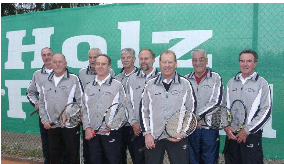
Herren 50 (Bezirksklasse 2)