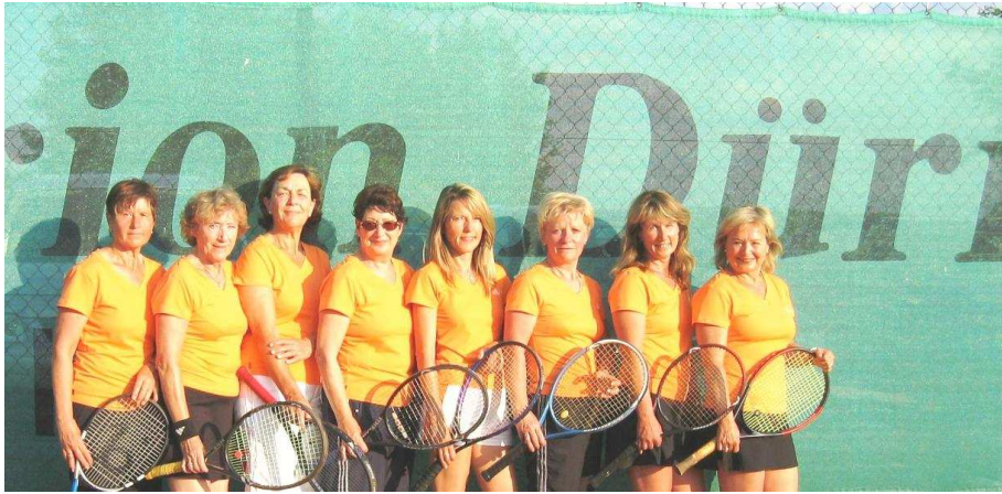
Damen 40 2. Mannschaft (Kreisklasse 2)