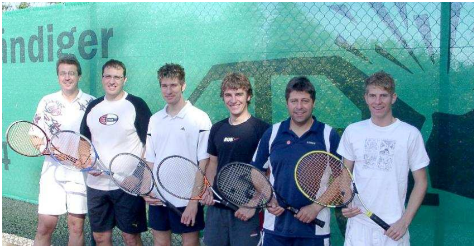
Herren 1 (Kreisklasse 1)