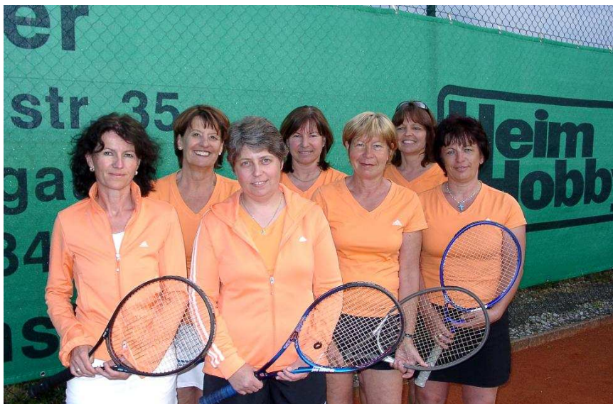
Damen 40 1. Mannschaft (Bezirksklasse 2)