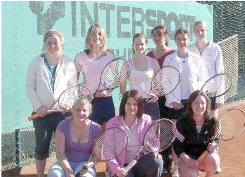
Damen 1 (Bezirksklasse 2)