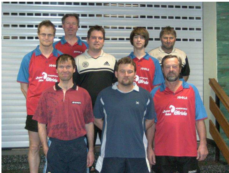
1. Mannschaft Herren mit ihrem Gegner den SV Wildsteig beim Punktspiel in Hohenfurch

Letztendlich repräsentieren wir ja Woche für Woche die Gemeinde Hohenfurch und den Sportverein.