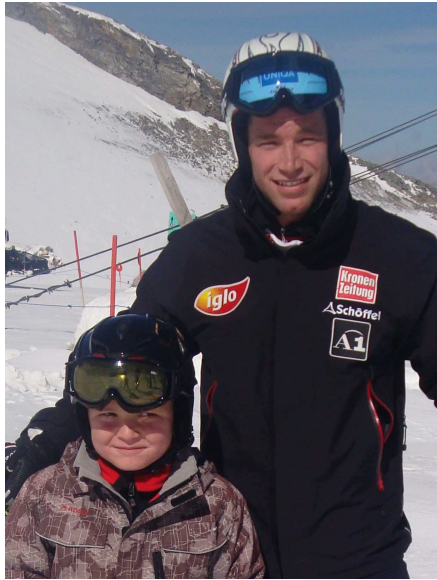
Niklas Pönitz mit Ski-Ass Benni Raich

Saisonaufaktler Niklas Pönitz war mächtig stolz auf die Begegnung mit Benjamin Raich. Der sympathische österreichische zigfache Weltcupsieger sowie Weltcupgesamt- und Olympiasieger war zeitgleich mit den Hohenfurchern zum Training auf dem Gletscher.