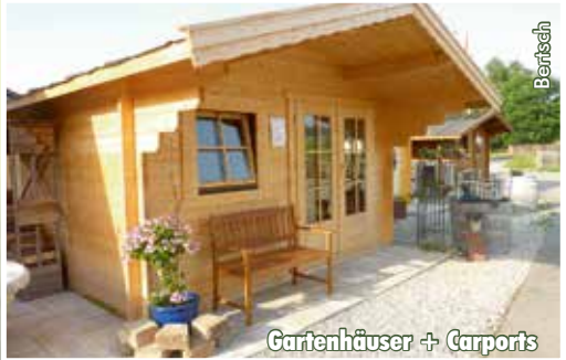
Gartenhäuser + Carports