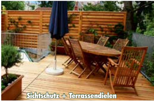
Sichtschutz + Terrassendielen