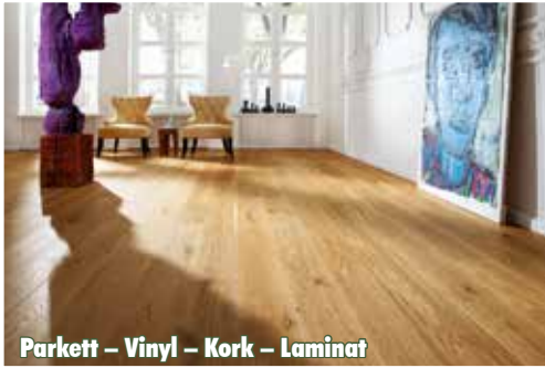
Parkett – Vinyl – Kork – Laminat