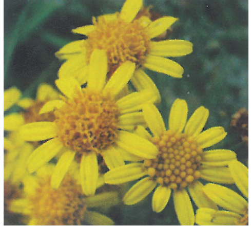
Blütenstand des Jakobs-Kreuzkrautes: Zungenblüten gelb, Röhrenblüten gelb

Bekämpfung: im April und Mai finden wieder zwei Begehungen am Landjugendkreuz (Lechstraße) witterungsabhängig statt. Die Termine werden kurzfristig bekannt gegeben. Freiwillige Helfer und interessierte Personen sind zur Mithilfe willkommen. Bitte bringen Sie Handschuhe mit.