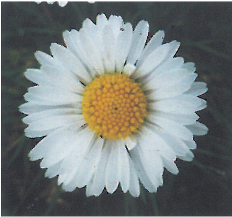
Blütenstand des Gänseblümchens: Zungenblüten weiß, Röhrenblüten gelb

Aussehen: Ein erstes Annähern wird durch eine weit verbreitete und gut bekannte Pflanze erleichtert: das Gänseblümchen. Gut zu sehen sind die Zungenblüten außen und die Röhrenblüten innen.